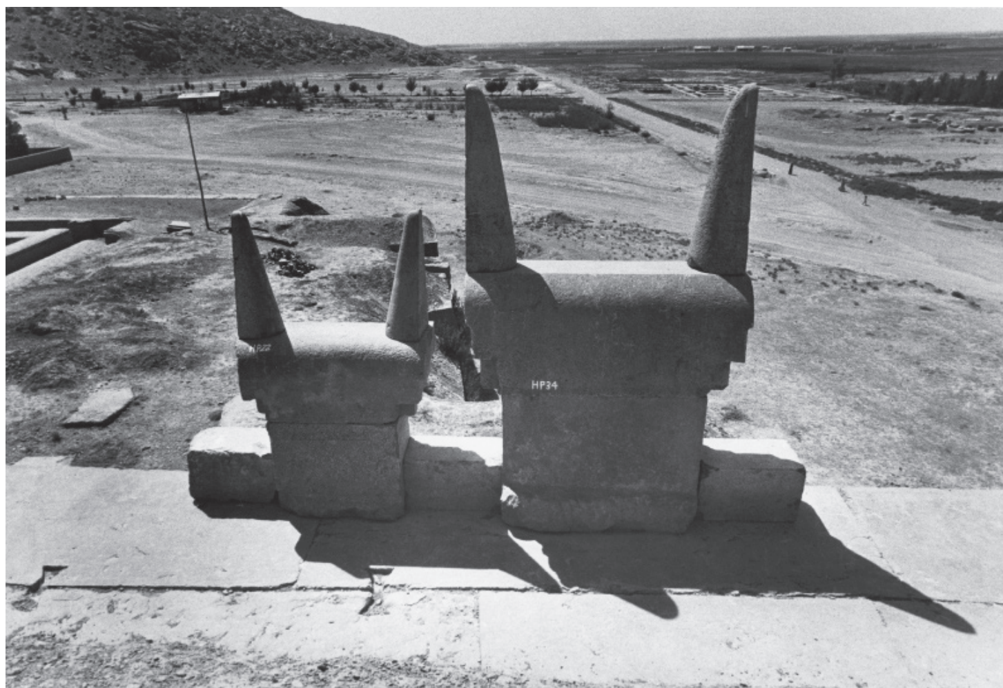
Gabriele Basilico Persepolis 6 , 1969 Série Iran 49 x 49 cm