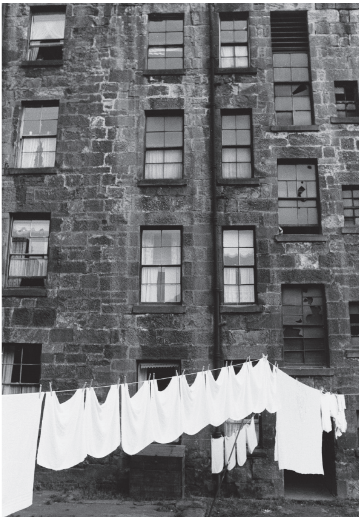
Gabriele Basilico 65-4, 1969 Série Glasgow 30 x 40 cm