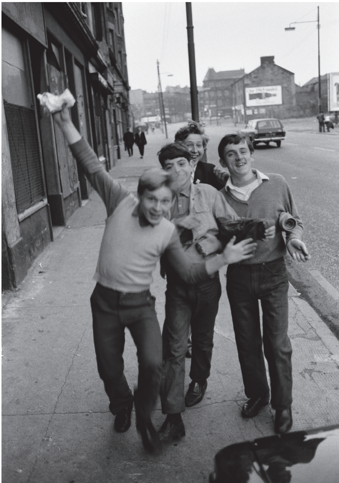
Gabriele Basilico 65-10, 1969 Série Glasgow 30 x 40 cm