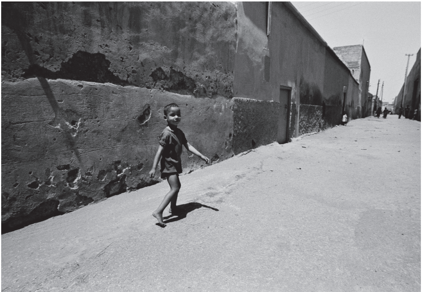
Gabriele Basilico Marrakech 303_19 , 1971 Série Marocco tirage d'époque 30 x 40 cm