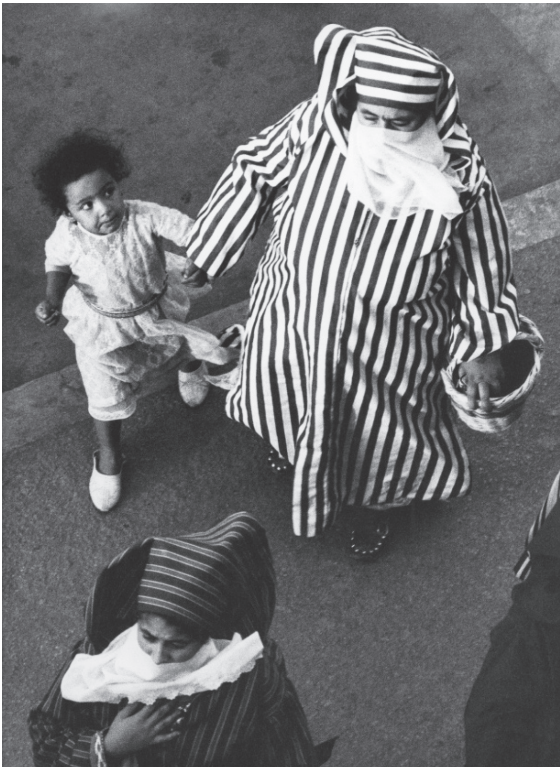
Gabriele Basilico Marrakech 304.16, 1971 Série Marocco tirage d'époque 30 x 40 cm