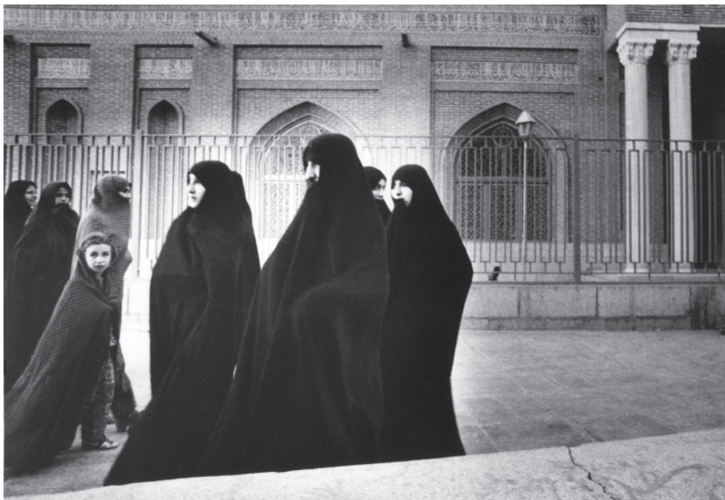
Gabriele Basilico Qom 186.19a , 1969 Série Iran tirage d'époque 49 x 49 cm