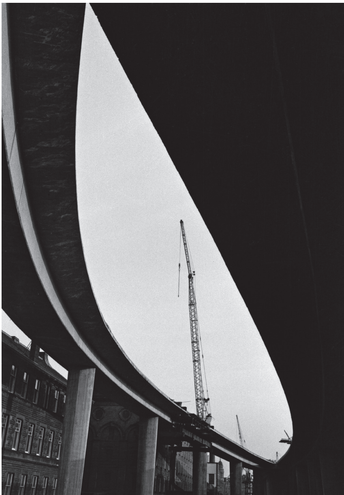
Gabriele Basilico 65-22 1969 Série Glasgow 30 x 40 cm