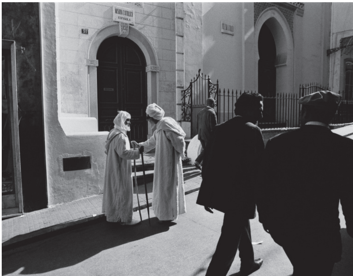
Gabriele Basilico Tangeri 299.17 , 1971 Série Marocco tirage d'époque 30 x 40 cm